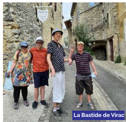
La Bastide de Virac