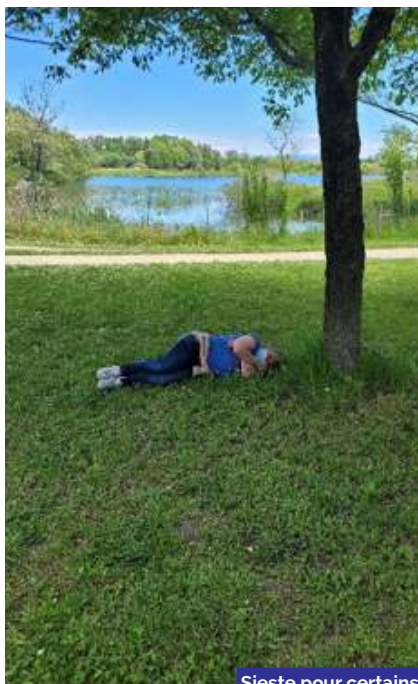
Sieste pour certains et jeux samedi du 8 mai 2021, à la base de loisir du Teil