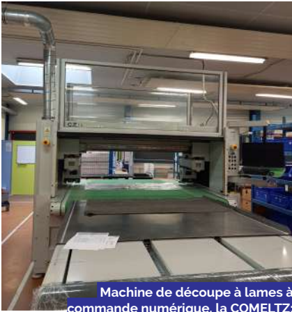
Machine de découpe à lames à commande numérique, la COMELTZ.

on programme la machine, et ses deux lames parcourent le matériau et le coupent comme prévu par le programme informatique.