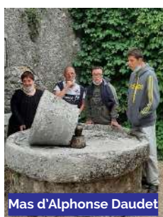
Mas d'Alphonse Daudet

Au programme de ces quatre jours : visite de la ville de Ruoms, de la grotte de l'Aven d'Orgnac, village de Labaume avec le mas d'Alphonse Daudet suivi d'une dégusta-