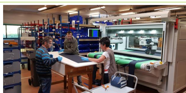
Découpe de blouses sortie Comelz