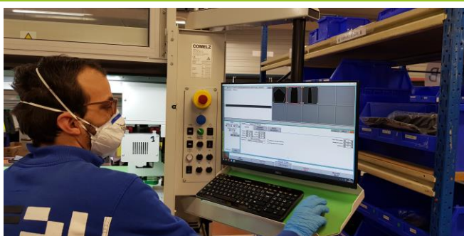
Découpe de blouse programmation Comelz