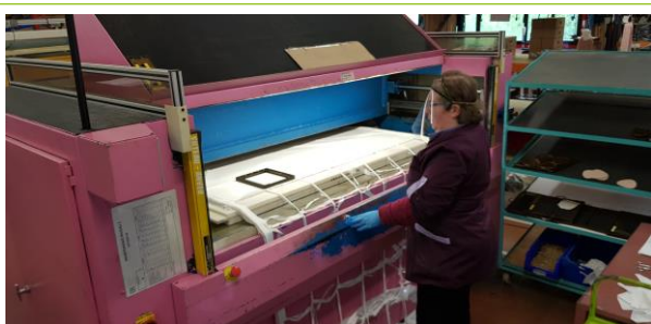
Decoupe de masques sur presse à pont