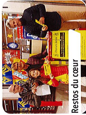
Restos du cœur